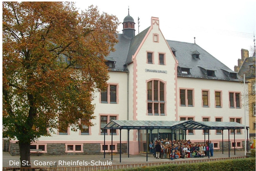
Die St. Goarer Rheinfels-Schule

Team engagierter Lehrerinnen stehen zusätzliche Betreuer - teilweise ehrenamtlich - zur Verfügung. In St. Goar fühlen sich die Kinder in ihrer Schule wohl. Für die Sicherung des Schulstand-